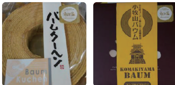
洋菓子のアンプチベアやぐま様 「小牧山バウムクーヘン」