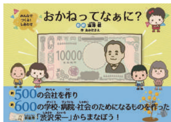
▲絵本「おかねってなあに」 (監修: 澁澤健、作: 岡田さえ)

絵本『おかねってなあに?』は、商工会議所の生みの親でもある渋沢栄一翁の言葉「よく集め、よく散ぜよ」などのお金に対する考え方・大切さを、子どもにも分かりやすく説明した内容。日本商工会議所青年部が『渋沢栄一翁プロジェクト』事業の一環で製作し、小牧商工会議所青年部として、市内図書館で活用してもらおうと、4月30日に小牧市へ寄贈いたしました。