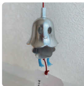
ダイキ精工(株)様の「こまちゃん風鈴」